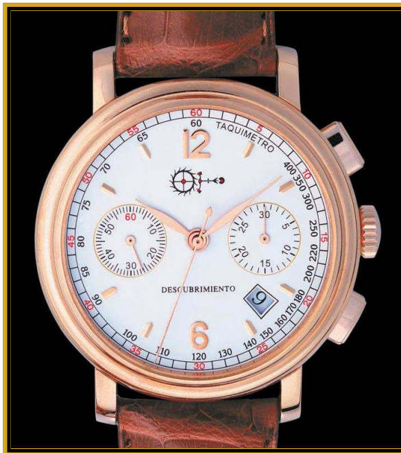
El reloj Descubrimiento se entrega con dos esferas: blanco y negro