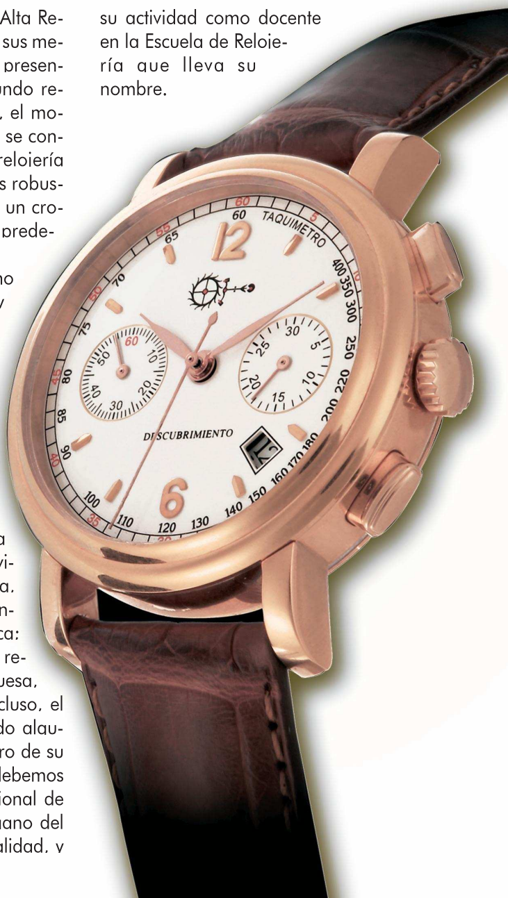
Elegantes proporciones para el nuevo cronógrafo automático Descubrimiento, segundo modelo de la colección Hispania

su actividad como docente en la Escuela de Relojería que lleva su nombre.