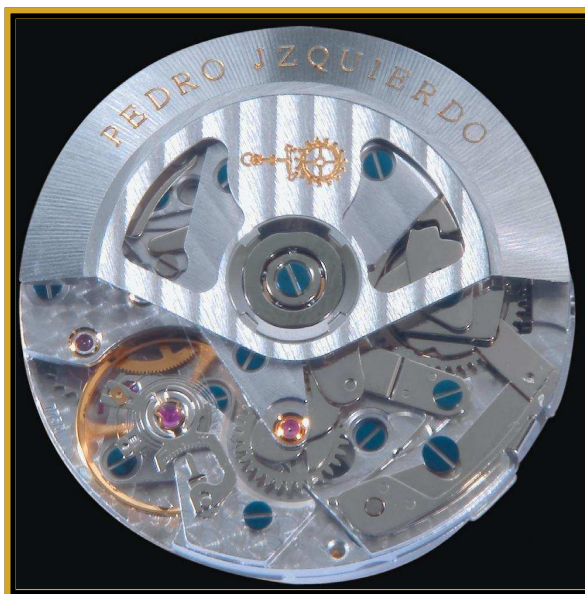
El mecanismo P104 ha sido finamente decorado y personalizado por su creador, especialmente la masa oscilante esauetizada

piel de cocodrilo de Luisiana, con lomo y cosida a mano. La correa puede ser en color marrón o negro, dependiendo del color de la esfera seleccionada en principio a hacer su compra del reloj Descubrimiento.